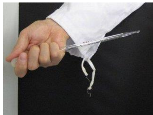
まちがった持ち方