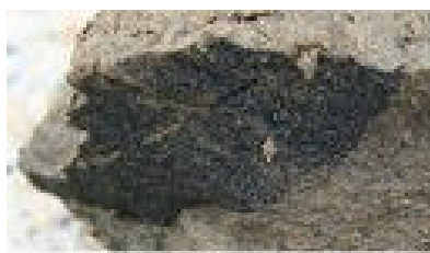
ブナ科と思われる植物化石