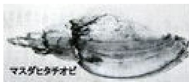
マスダヒタチオビ