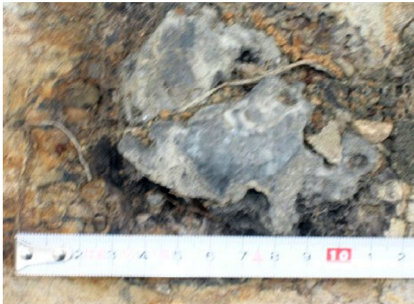
炭化した植物化石（野積川河川敷）