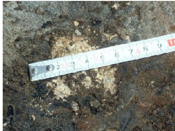
貝化石（野積川河川敷）