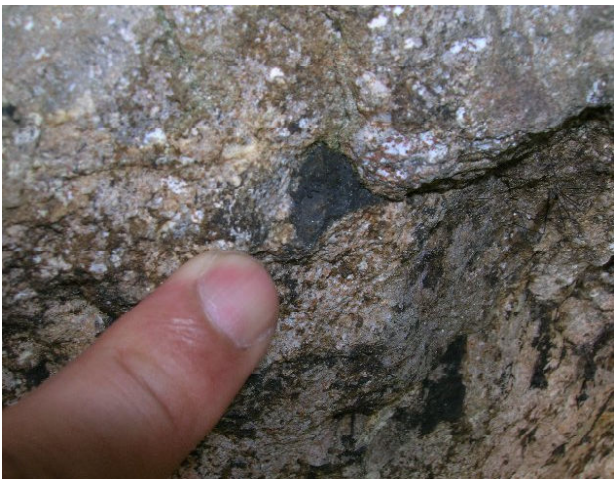
凝灰岩の中の植物化石