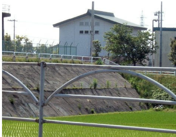
金屋付近に残る段丘崖